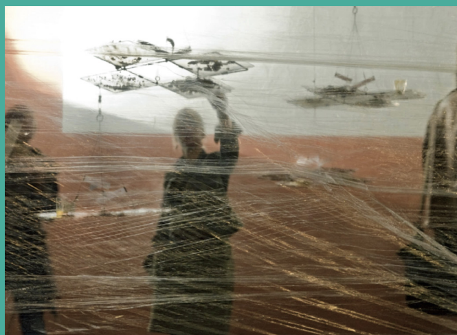
Performance, Le grand Mobile